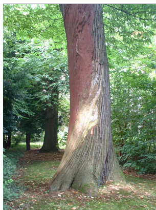
, 24 August 2005

XLSX (Excel 2007) - XLS (Excel 1997-2003) .